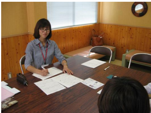
サービス担当者会議での面談の様子。